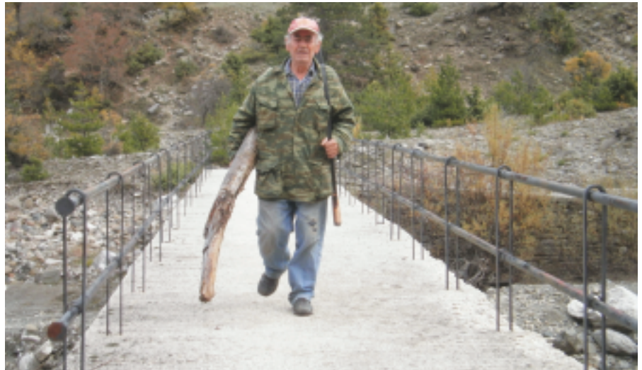
Περνώντας το γεφύρι στο πρόσφατο παρελθόν. Για το μέλλον έχει ο Θεός...

Τα παράπονα για την τηλεόραση στο χωριό ποτέ δεν μας έλειψαν. Όποιος πάει να δει το κτίσμα που φιλοξενούνται οι αναμεταδότες, θα απογοητευτεί. Δεν μας