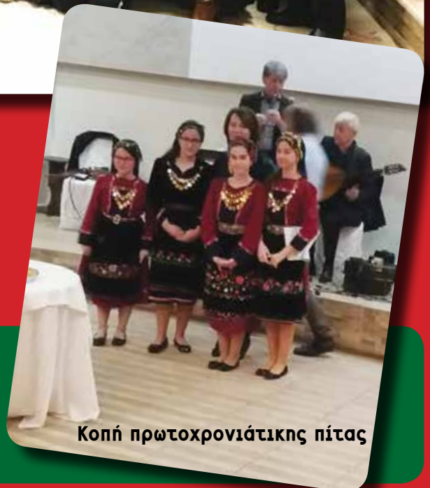
Κοπή πρωτοχρονιάτικης πίτας

Το Διοικητικό Συμβούλιο της Αδελφότητας εύχεται σε όλους Χρόνια Πολλά και Καλή Ανάσταση με Υγεία! Το φως της Ανάστασης να χαρίσει σε όλους ελπίδα και να φέρει γαλήνη