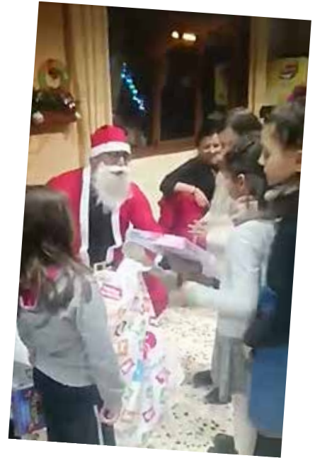
Το χαμόγελο των παιδιών σε χρονιάρες μέρες είναι ανεκτίμητο.

Η Αδελφότητα Ιωαννίνων έκοψε την βασιλόπιτα της στο Ζαϊρέ που σημαίνει Μεζέ... Σε έναν χώρο προσεγμένο με εκπληκτική θέα οι Κερασοβίτες στα Γιάννενα απόλαυσαν πεντανόστιμους μεζέδες και ευχήθηκαν μία όμορφη και δημιουργεί χρονιά με υγεία.